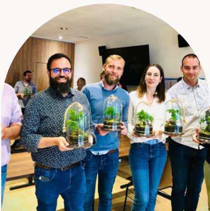
TEAM CULTURA DIRECTEUR DE MAGASIN

QU'EST CE QU'A APPORTÉ CET ATELIER DANS VOTRE JOURNÉE D'ÉQUIPE ?