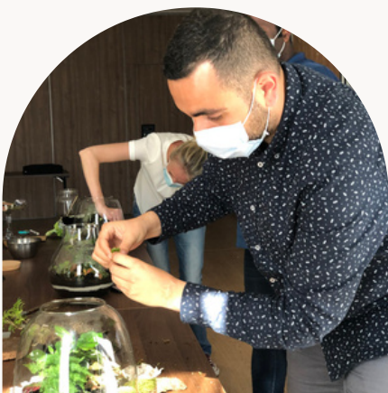
TEAM CHANEL - ÉQUIPE LOGISTIQUE

LA TOUCHE QUE VOUS PRÉFÉREZ DE VOTRE TERRARIUM?